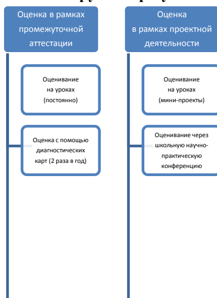
Схема оценки метапредметных планируемых результатов обучающихся ООО

В школе разработан и апробируется мониторинг предметных и метапредметных результатов освоения обучающимися образовательных программ основной и старшей школы в соответствии с ФГОС.